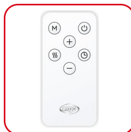
Pilot na podczerwień typu „Slim”