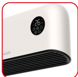
Mocny, zoptymalizowany przepływ powietrza skierowany w dół