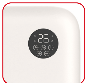
Wyświetlacz LED z przyciskami soft touch

Kompaktość i całkowita czystość formy. Po zamontowaniu na ścianie staje się jej integralną częścią. Czystą biel matowej powierzchni przerywa okrągły wyświetlacz, który pozwala mieć pod kontrolą wszystkie funkcje produktu. Idealny do łazienki dzięki ochronie IP22, doskonale pasuje do nowoczesnych wnętrz.